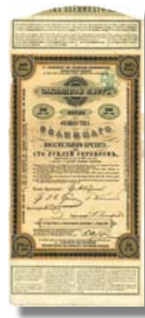
Лот 580 VF Русские 4,5% Железнодорожные облигации Петроград, сентябрь 1917, временное свидетельство Российских 4,5% Железнодорожных облигаций на 1 облигацию в 100 руб., №33001, 31 x 21,8 см, охровый, печать, мелкие разрывы по нижнему краю, данный высокий номинал не встречается в каталоге Друм/Хензелер. Это временное свидетельство было выдано не за долго до Октябрьской революции. А объединенный выпуск состоял из займов следующих 15 обществ железных дорог: Ачинск-Минусинской, Бессарабских, Бухарской, Владикавказской, Кольчугинской, Московско-Казанской, Московско-Виндаво-Рыбинской, Московско-Киево-Воронежской, Оренбург-Уфимской, Подольской, Рязанско-Уральской, Северо-Донецкой, Троицкой, Верхне-Волжской и Южно-Сибирской. Стартовая цена: 300 EUR