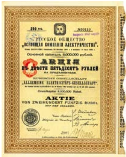
Лот 575 EF Русское общество «Всеобщая компания электричества» С.-Петербург, 1911, акция в 250 руб., №30110, 32,5 x 25 см, коричневый, черный, остатки купонов, складка поперек, на русском и немецком языках. Стартовая цена: 65 EUR